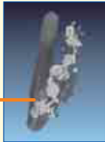
仏像の中に 内臓の ようなもの が見えるよ