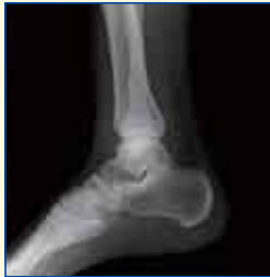
どこが折れているか、 分かるかな？ (答えは14ページ)