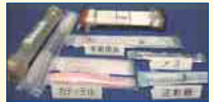
細菌を退治し、きれいにした医療品